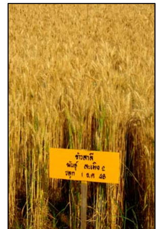
ข้าวสารี พันธุ์ละเมิง 2