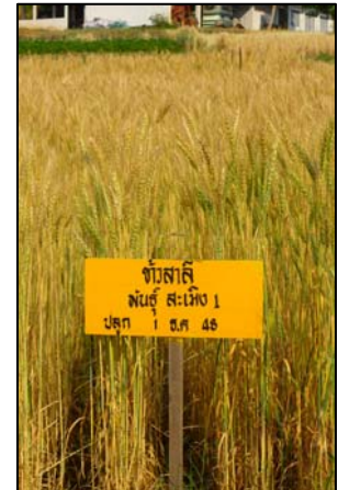
ข้าวสารี พันธุ์ละเมิง 1