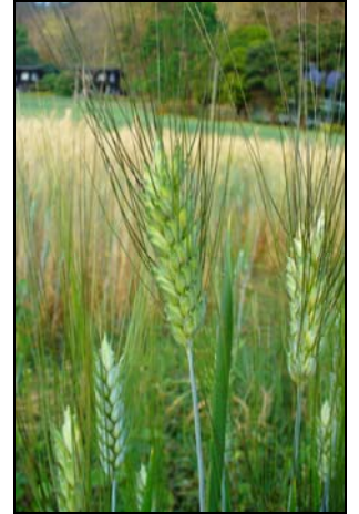
ข้าวสารีชนิดใช้แบ่งทำขนมปัง (ซ้าย) ข้าวสารีชนิดใช้แบ่งทำมักกะโรนี (ขวา)

ตารางแสดงพันธุ์ข้าวสารีที่ได้เสนอเป็นพันธุ์รับรอง